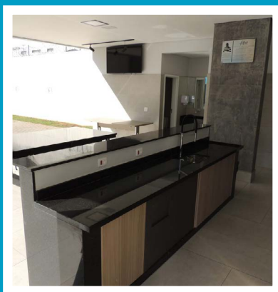
Inauguração da Área de Lazer